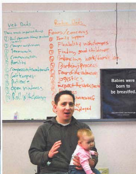
Les bébés des «veteran dads» servent de cobayes pour les exercices pratiques.