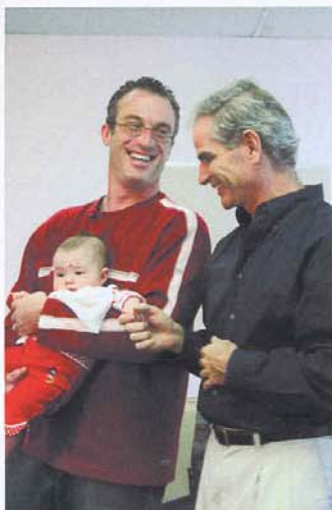
Le principe des stages est fondé sur l'échange d'expériences.