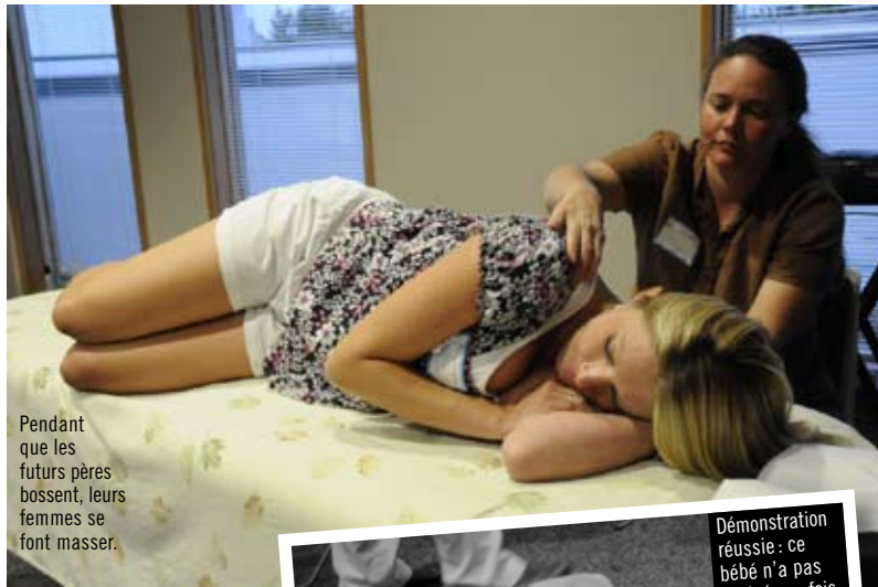
Pendant que les futurs pères bossent, leurs femmes se font masser.