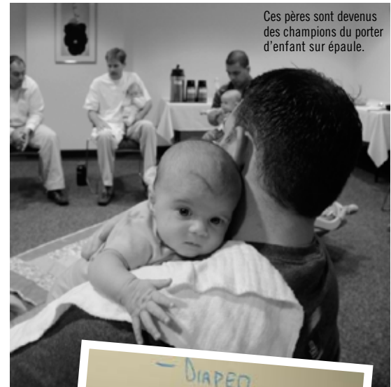
Ces pères sont devenus des champions du porter d'enfant sur épaule.