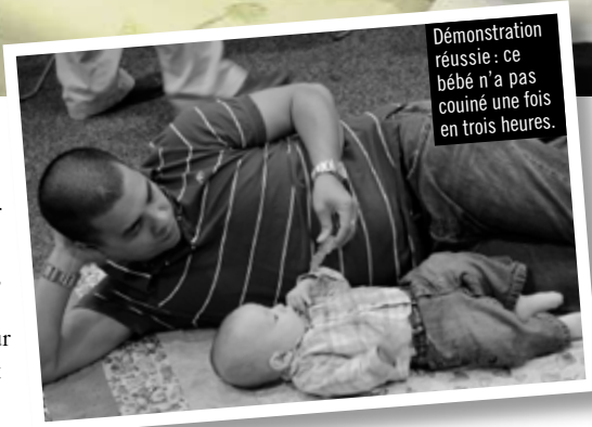
Démonstration réussie: ce bébé n'a pas couiné une fois en trois heures.